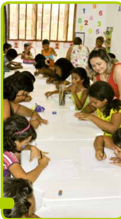
Atividades realizadas pelo NDS com a comunidade de Nova Jerusalém

O belo trabalho realizado pelo projeto Nova Jerusalém a um passo do futuro rendeu frutos ao NDS, que venceu a etapa estadual do Prêmio Anu Dourado, realizado pela Central Única das Favelas (Cufa), como melhor ação social desenvolvida em 2012 no Rio Grande do Norte. O Prêmio Anu tem como intuito reconhecer ações voltadas a pessoas em situação de vulnerabilidade e realizadas em favelas e comunidades de todo o País, identificando trabalhos que possam trazer um novo olhar e garantir um futuro para o lugar, melhorando a situação socioeconômica e tornando a sociedade mais justa. Para o coordenador do projeto vencedor, a premiação é válida no sentido de valorizar as ações realizadas pelo instituto, bem como no de chamar a atenção das pessoas comuns e de empresários para a importância do trabalho que é feito pelo NDS.