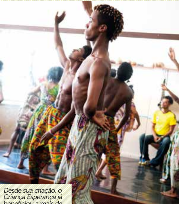
Desde sua criação, o Criança Esperança já beneficiou a mais de 4 milhões de crianças e adolescentes de todo o Brasil